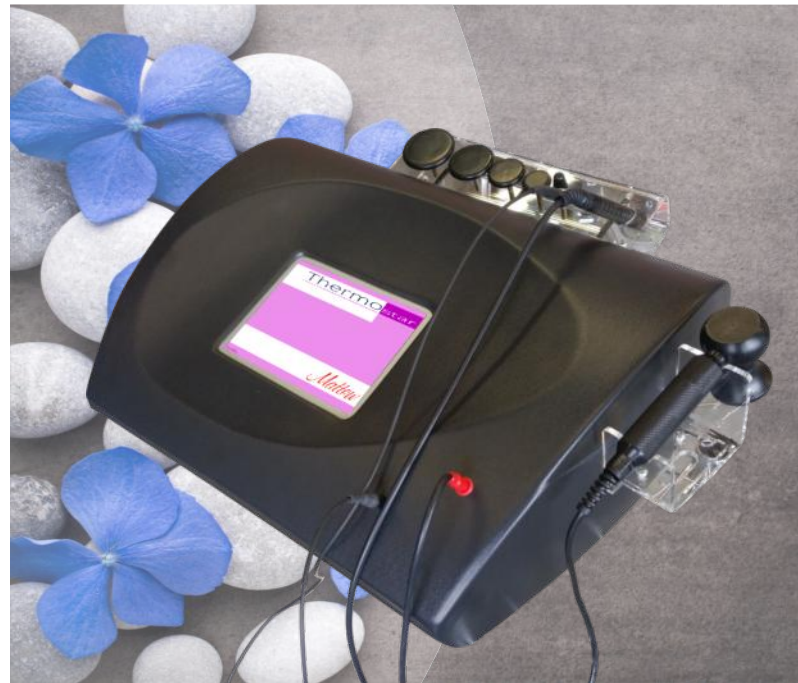
ELETTRODO DI RIFERIMENTO

La tecnologia a radiofrequenza capacitiva variabile